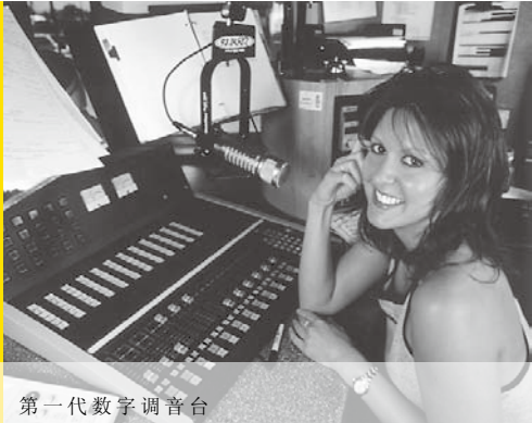
第一代数字调音台