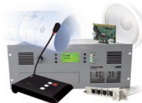
VARIZONE VAB-Line [2007]

第一套集成模拟技术于数字架构下的，混合型扩声和公共广播系统。 北莱茵-威斯特法伦州议会，德国