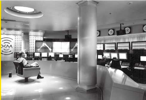
在XM卫星广播电台的设施