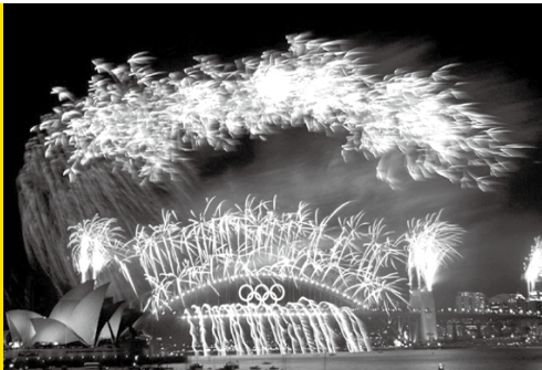
2000年悉尼奥林匹克运动会