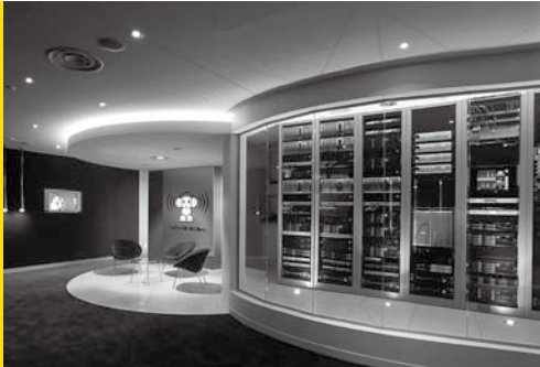
澳大利亚DMG广播电台