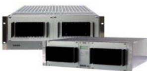
VADIS 888 & VADIS 212 [2006]